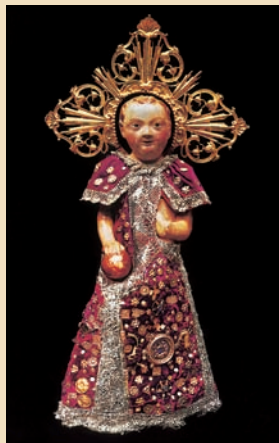
Sarner Jesuskind im Frauenkloster St. Andreas

Ein Obwaldner Kulturwanderführer über den Jakobsweg ist im Buchhandel oder bei den Tourismusbüros erhältlich.