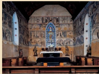
Kapelle St. Niklausen